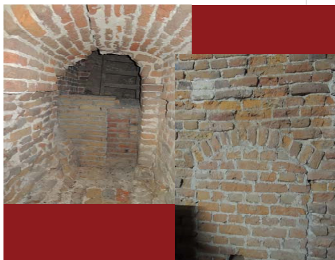
De oude toren in de nieuwe toren