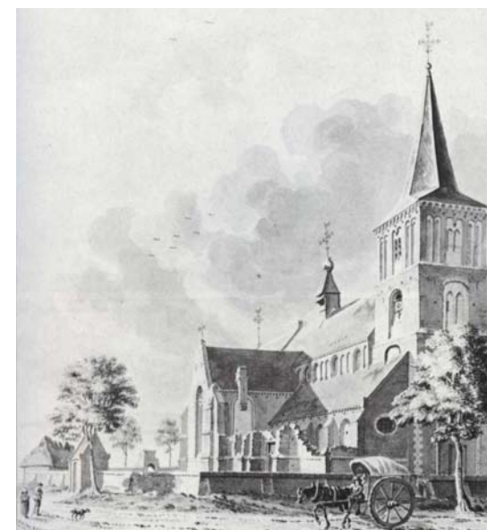
in 1738, getekend door Jan de Beijer