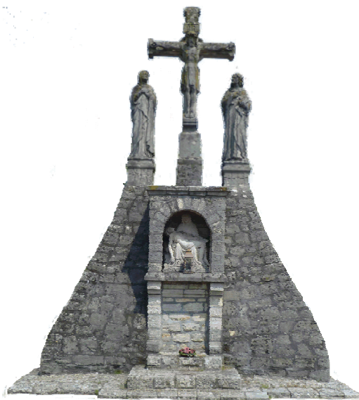
De Calvarieberg, begraafplaats (1919)