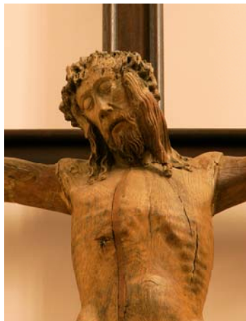
Detail van het kruisbeeld (ca. 1500)